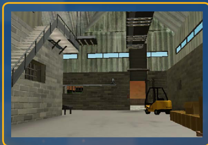
Model środowiska symulacyjnego oraz przykładowego robota